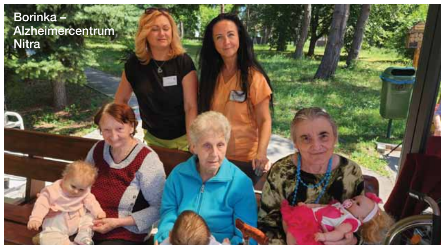
Borinka – Alzheimercentrum Nitra