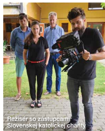
Režisér so zástupcami Slovenskej katolíckej charity

utorňajšej výroby sme vedeli, že nás čaká už len jeden príbeh.