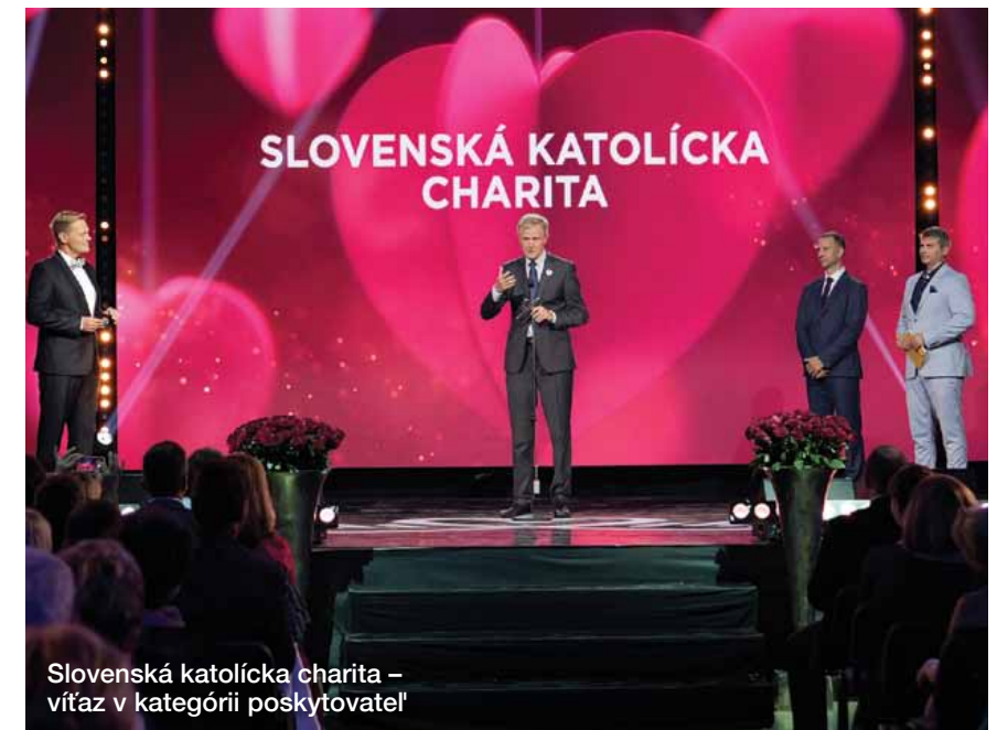
Slovenská katolícka charita – víťaz v kategórii poskytovateľ