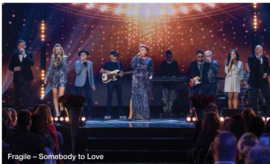
Fragile – Somebody to Love

„V sociálnych službách ich máme viac ako dve tisíc a potrebujeme ich raz toľko. Hovoríme o sestrách. Hoci to verejnosť nevie, sestra je jednou z kľúčových profesií aj v zariadeniach sociálnych služieb. Brúsená skúsenosťami, krízovými situáciami cibrí svoju schopnosť správnych rozhodnutí. Musí ich robiť sama, často a rýchlo. Nie vždy má po svojom boku lekára.“